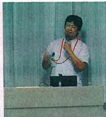
加賀野井乳線外科部長