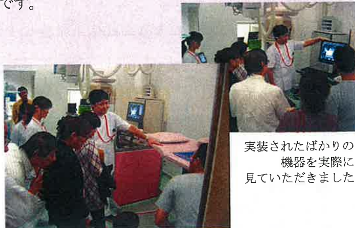
実装されたばかりの機器を実際に見ていただきました

早期発見早期治療にて高い生存率が望めます。マンモトームシステムは組織を採取し、検査することが目的です。