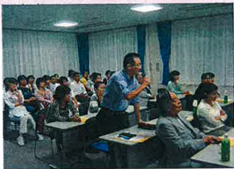
当日は活発な質疑応答がなされました

をスローガンに広報活動を行っています。無症状の場合であっても健診で発見される場合もあります。適齢期の方にはぜひ受検をお勧め